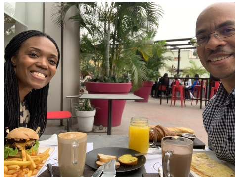
Nous avons célébré notre 22ème anniversaire de mariage